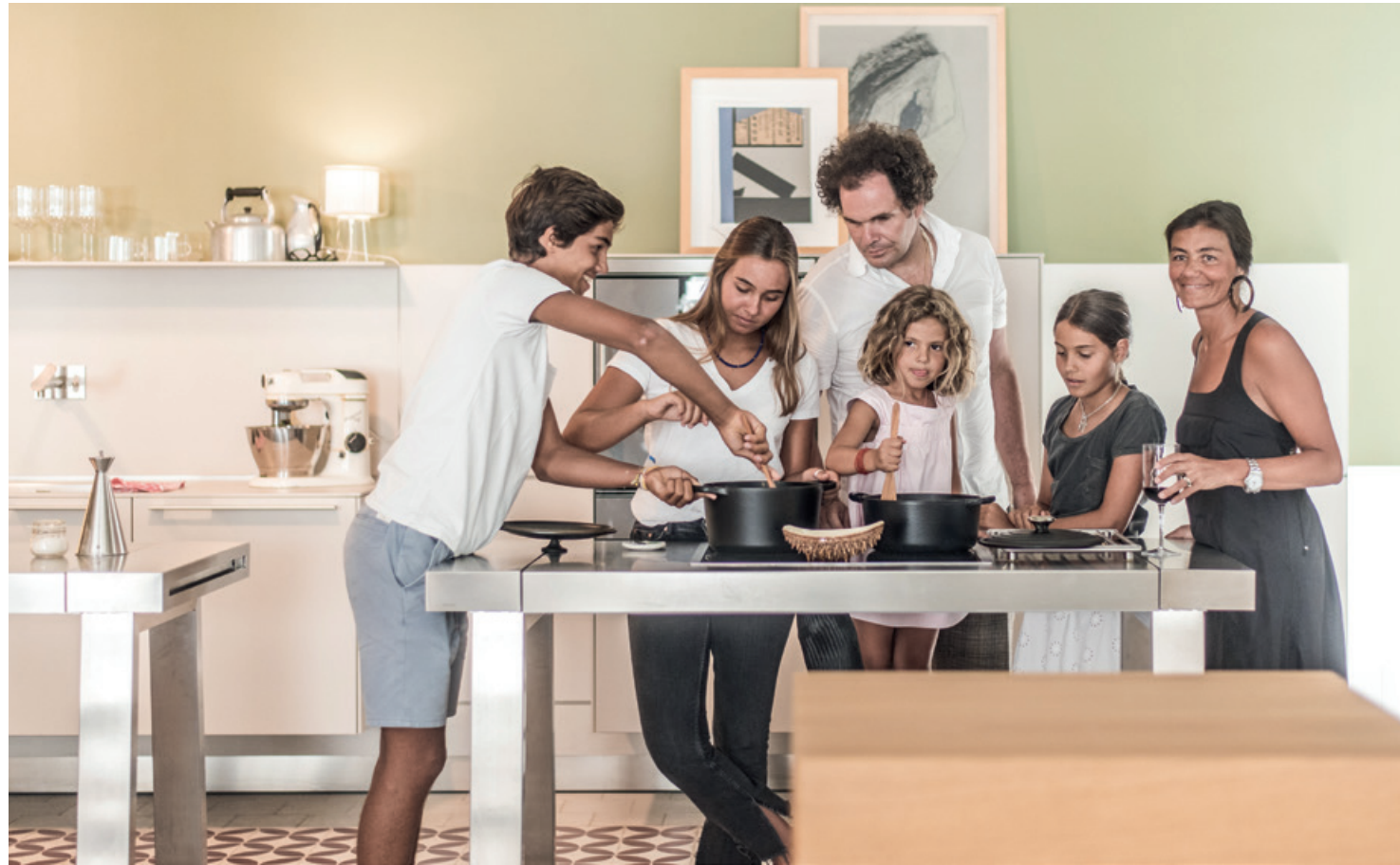
Bulthaup b2, bulthaup libos, Casa Fortunato © Adriano Pedraza Profumo