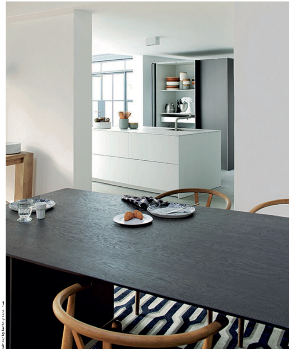
bulthaup b3, bulthaup Capri Town