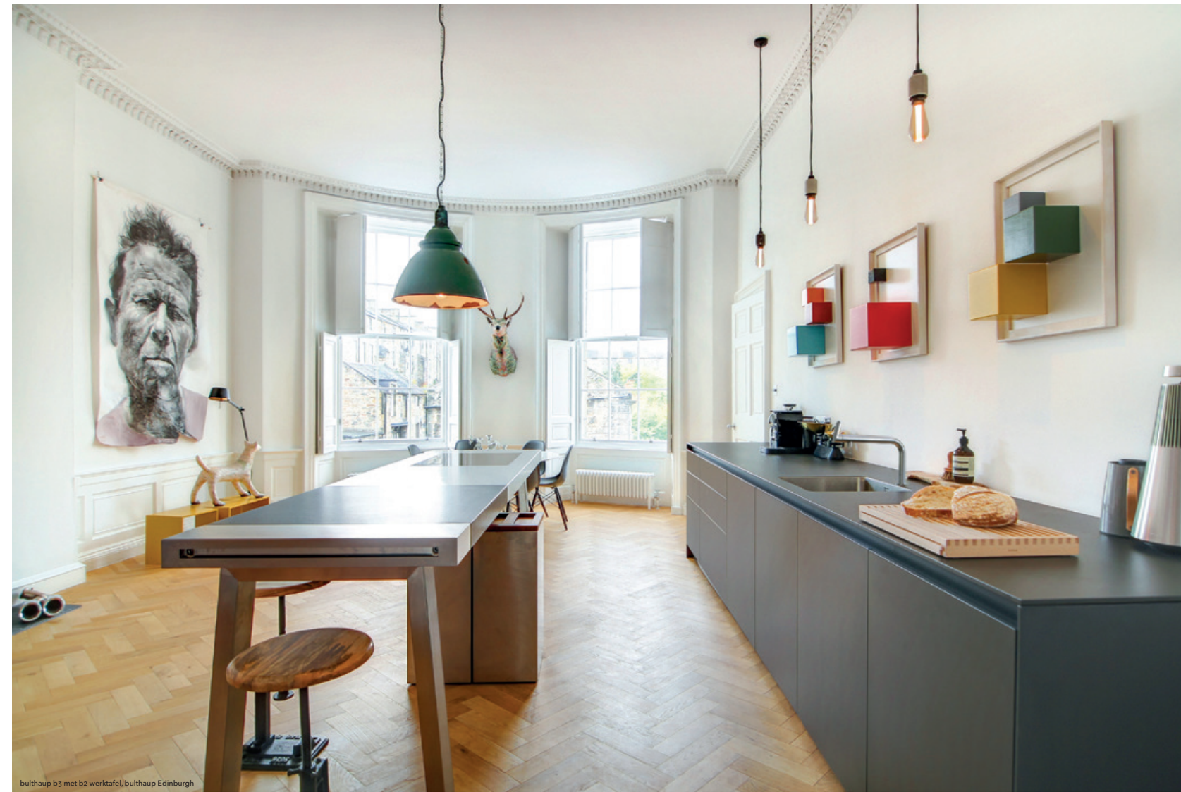
bulthaup b3 met b2 werktafel, bulthaup Edinburgh