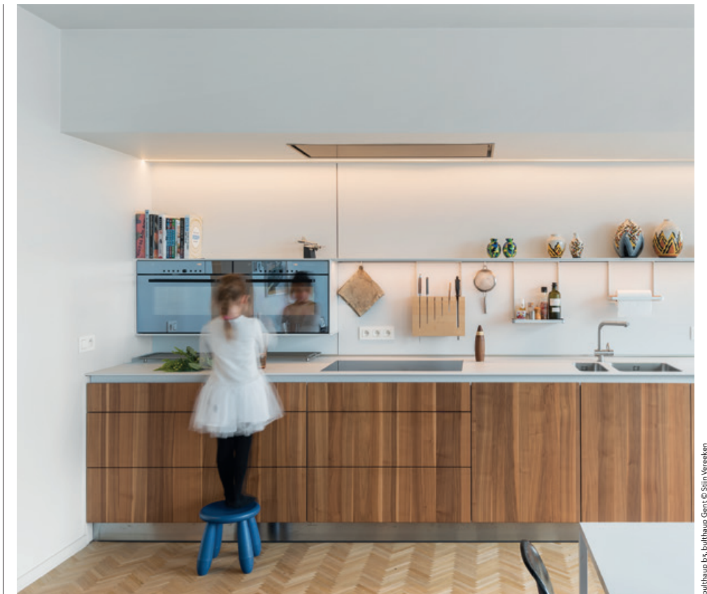
bulthaup b3, bulthaup Gant

Om deze behoefte te ondersteunen, moeten de leefgewoontes en de emotionele noden van de gebruiker centraal staan in een bulthaup-ontwerp. "Onze keukenarchitectuur dient om hun leven eenvoudiger te maken." Een credo dat het keukenbedrijf al vanaf het begin ter harte neemt. Daarbij werkt de producent volgens de ontwerpfilosofie "vorm volgt functie", een van de fundamentele ontwerpprincipes van het Weimarse Bauhaus. Een keuken moet in de eerste plaats vooral goed doordacht zijn en ontworpen naar zijn functie. Al mag de elegantie van het ontwerp uiteraard ook niet uit het oog verloren worden. En ook op esthetisch vlak geldt een terugkeer naar de essentie, zoals de keuze van de designers voor minimalisme en opgeruimde schoonheid ook bewijst. Er wordt gewerkt met een duidelijke vormtaal: de dingen zo eenvoudig en helder mogelijk maken. "Het materiaal is zo dun mogelijk, maar zo dik als nodig. We hebben weinig kleuren in het aanbod, maar wel de juiste. We hebben geen ruim assortiment aan deurklinken nodig, we hebben net dat ene perfecte handvat voor jou. De inrichting van de keuken is een kunst, maar vooral een levenskunst," horen we nog.